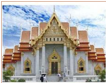
ตัวอย่างวัดของศาสนาพุทธ

พจนานุกรมพุทธศาสน์ ฉบับประมวลศัพท์ (2538: 291) ได้นิยามความหมายของ “ศาสนา” ว่าเป็น คำสอน, คำสั่งสอน, ปัจจุบันใช้หมายถึงลัทธิความเชื่อถืออย่างหนึ่งๆ พร้อมด้วยหลักคำสอน ลัทธิพิธี องค์กรและกิจการทั่วไปของหมู่ชนผู้นับถือลัทธิความเชื่ออย่างนั้นๆ ทั้งหมด รายละเอียดเกี่ยวกับศาสนาต่างๆ ในประเทศไทย ดูเพิ่มเติมใน ภาคผนวก ก สรุปลความหมายของ “ศาสนา” ว่าเป็นแบบแผนความเชื่อที่ตอบสนองความศรัทธาของสังคม