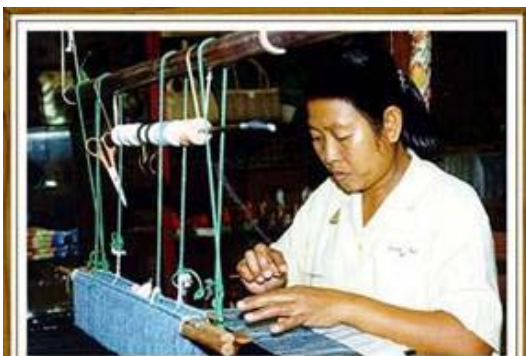
การทอผ้าจัดเป็นศิลปะพื้นบ้านหรือศิลปะท้องถิ่น

ประเภทที่ 3 คือ กีฬาหรือการละเล่นพื้นบ้าน เช่น การแข่งกลองเง็ง เป็นต้น