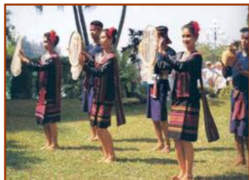
เซิ้งสวิงเป็นการแสดงพื้นบ้านของภาคอีสาน