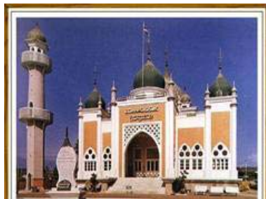
ตัวอย่างมัสยิดของศาสนาอิสลาม