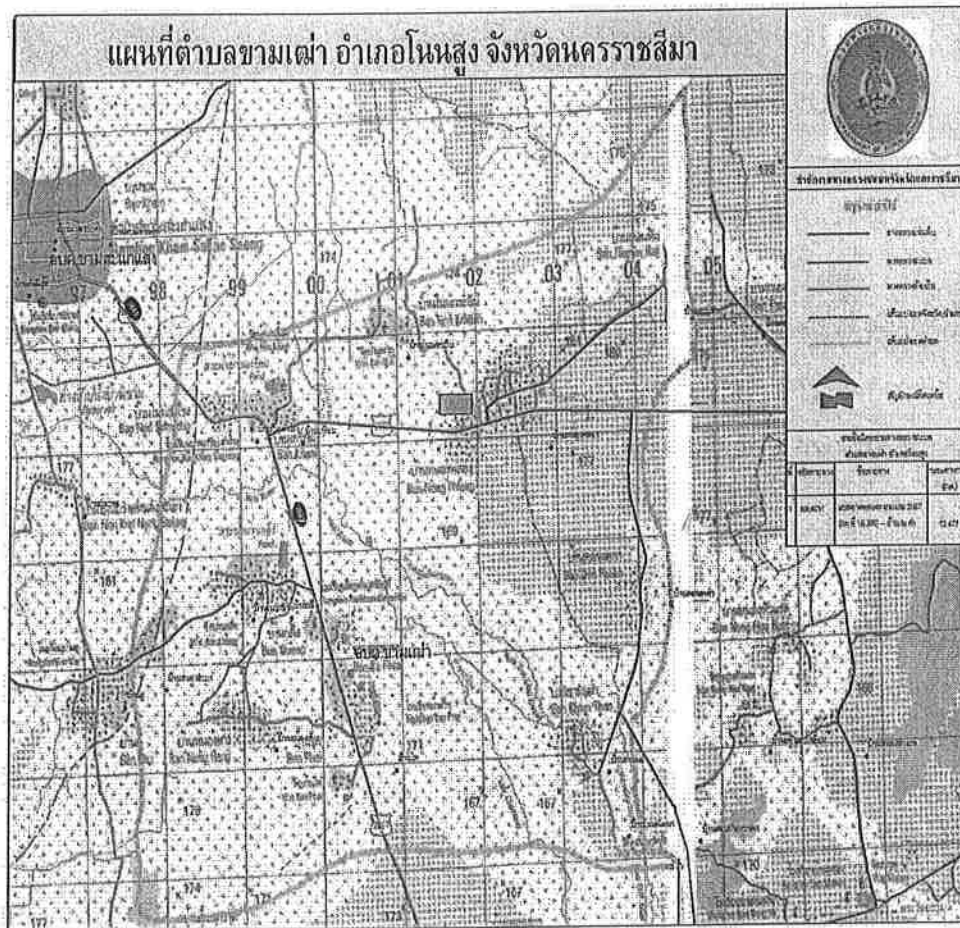
แผนที่ : แสดงอาณาเขต องค์การบริหารส่วนตำบลขามเฒ่า อำเภอโนนสูง จังหวัดนครราชสีมา